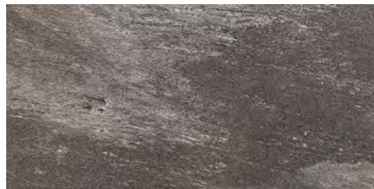
MMXQ Beola20 Antracite 50x100