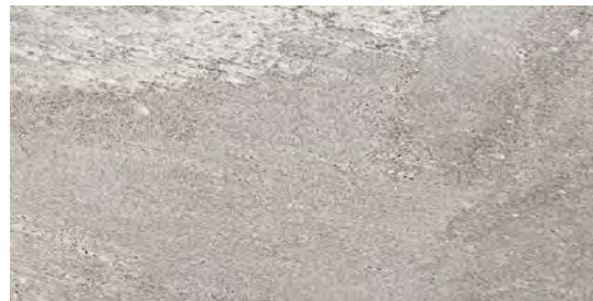
MMXN Beola20 Grigio 50x100