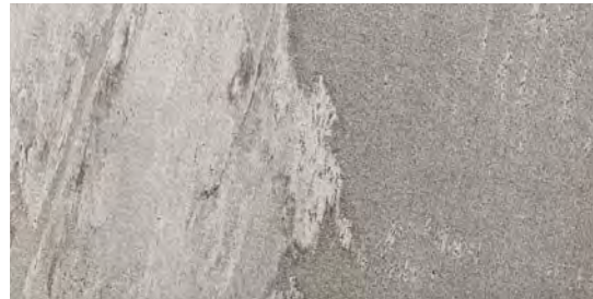
MMXP Beola20 Greige 50x100